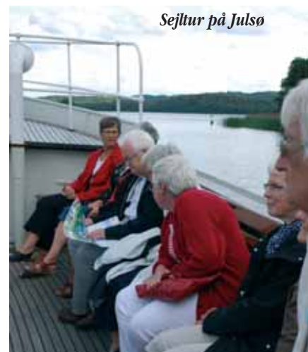
Sejltur på Julsø