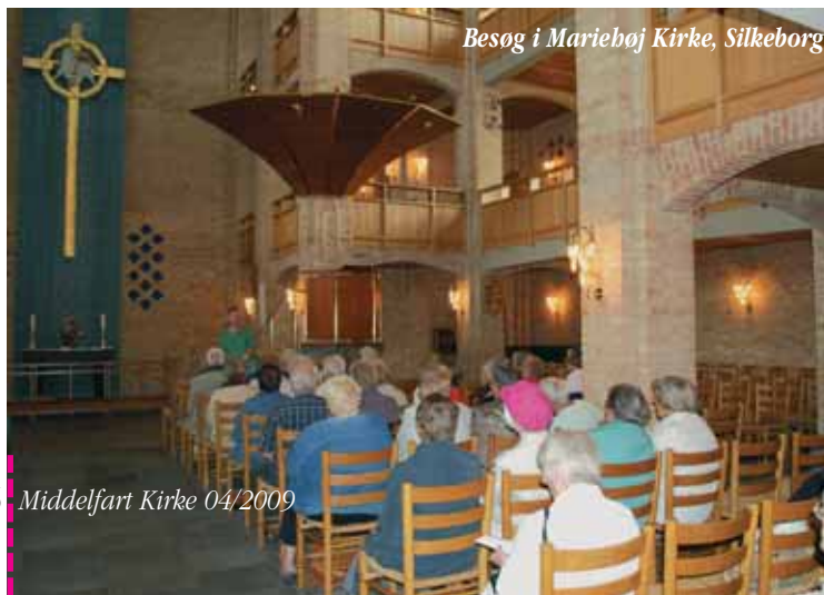
Besøg i Mariehøj Kirke, Silkeborg

På gensyn til næste års september-udflugt!