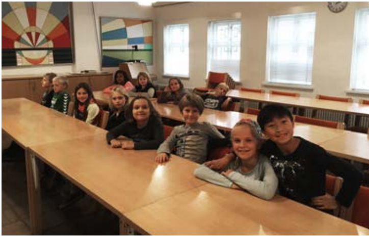
Artige minikonfirmander venter på at resten af holdet ankommer

i foråret 2016. Undervisningen går i gang lige efter vinterferien og det bliver tirsdag eller torsdag fra 14:15-15:30.